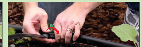
4 MASUKKAN UJUNG DRIP TAPE KE CONNECTOR, KEMUDIAN PUTAR RING YANG ADA PADA CONNECTOR