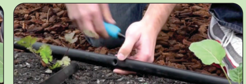
2 BOR PIPA DENGAN MENGGUNAKAN MATA BOR 16 MM