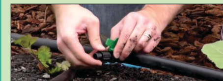
3 PASANG TAKE OFF PADA LUBANG PIPA YANG TELAH DI BOR