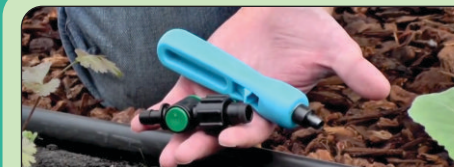
1 SIAPKAN TAKE OFF DAN BOR